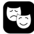
Uitbeelden, drama en fantatiespel