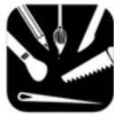
Tekenen, boetseren, knutselen en schilderen

Loose parts play geeft kinderen ongelooflijk veel mogelijkheden. Je kan al deze speelgebieden met dit materiaal observeren en stimuleren.