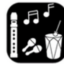
Muziek maken en zingen