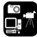
Media en digitale wereld